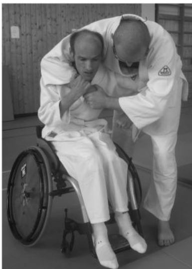
seitlicher Angriff / Armwürger -> Anwendung der Selbstverteidigung - Hebeltechnik