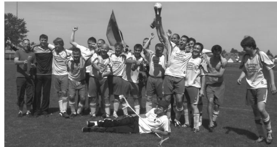
Riesiger Jubel zum B-Klassenaufstieg der 2. Mannschaft nach dem letzten C-Klassenspiel in Malching

Natürlich wurde dann gebührend gefeiert. Bereits auf dem Platz in Malching, in der Kabine und anschließend auf dem Sportplatz in Aufkirchen bei einer spontanen Aufstiegsfeier, welche bis in die frühen Morgenstunden dauerte.