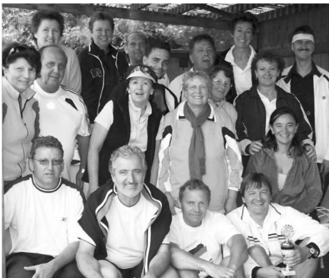
Alle Teilnehmer beim Schleiferlturnier

Am 07. August fand das alljährliche Grillfest am Tennisplatz mit 25 Personen statt.