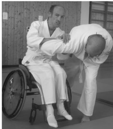
Ellenbogenstoß als Befreiung